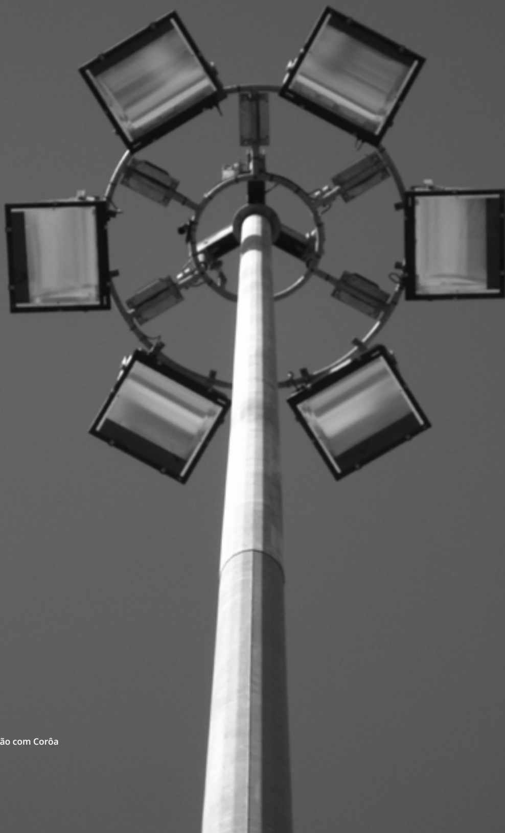
Torre de Iluminação com Corôa Portugal 2014