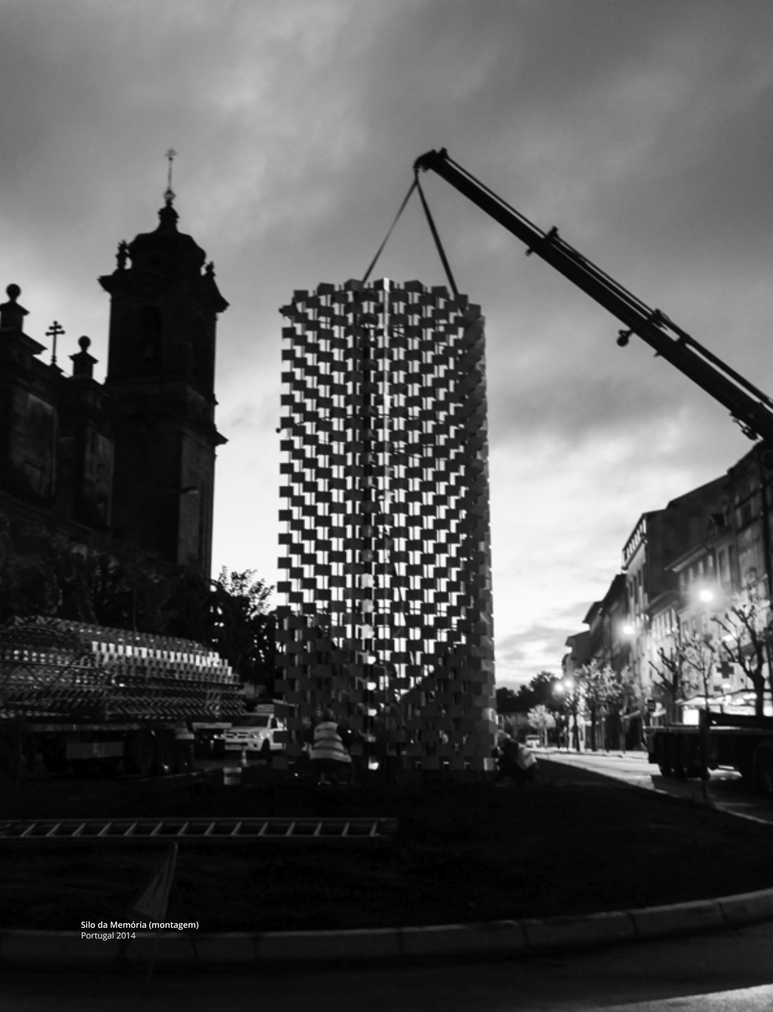
Silo da Memória (montagem) Portugal 2014